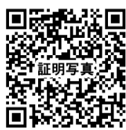
就活用証明写真 撮影予約フォーム

→撮影スタジオにてお支払いとなります。お支払いは現金のみとなりますので、事前にご準備ください。